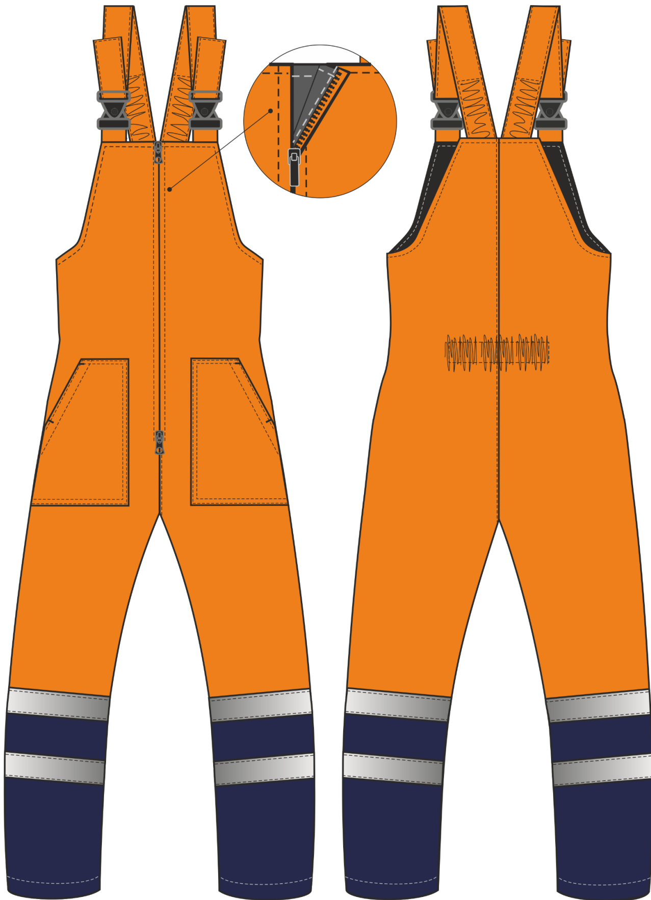
Рис.3. Эскиз Костюм зимний Дорожник-Ультра (тк.Смесовая,210) п/к, оранжевый/т.синий. Полукомбинезон, вид спереди и сзади.