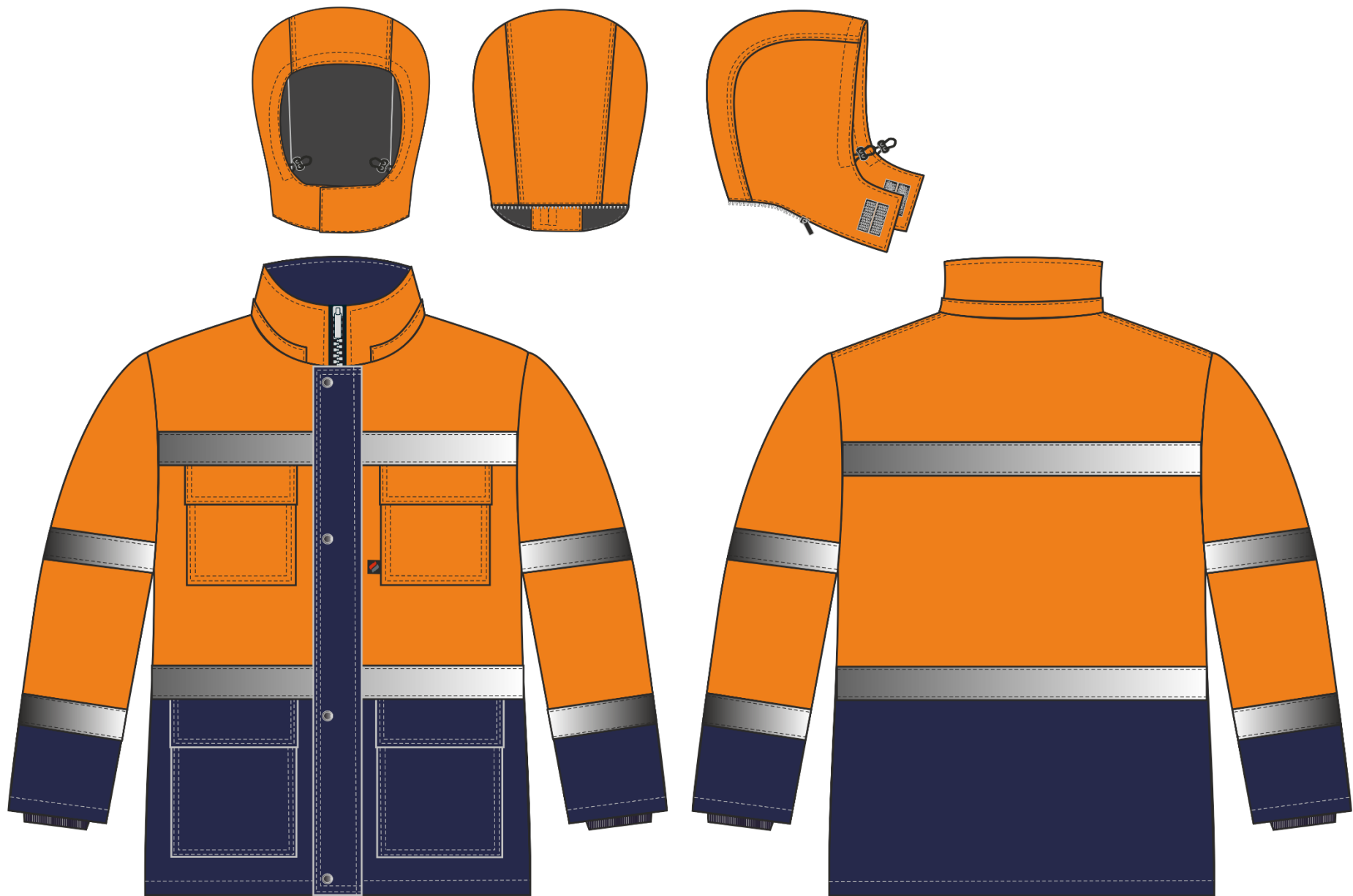
Рис.1. Эскиз Костюм зимний Дорожник-Ультра (тк.Смесовая,210) п/к, оранжевый/т.синий. Куртка, вид спереди и сзади. Капюшон, вид спереди, сзади и сбоку.