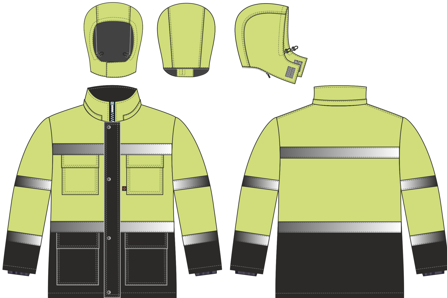
Рис.2. Эскиз Костюм зимний Дорожник-Ультра (тк.Смесовая,210) п/к, лимонный/черный. Куртка, вид спереди и сзади. Капюшон, вид спереди, сзади и сбоку.