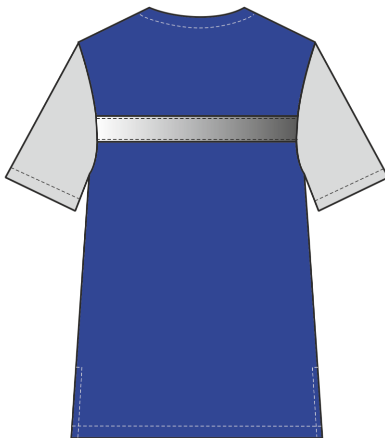
Рис. 1. Эскиз Костюм Скорая помощь СОП (тк.ТиСи,120), васильковый/серый. Блуза, вид спереди и сзади.