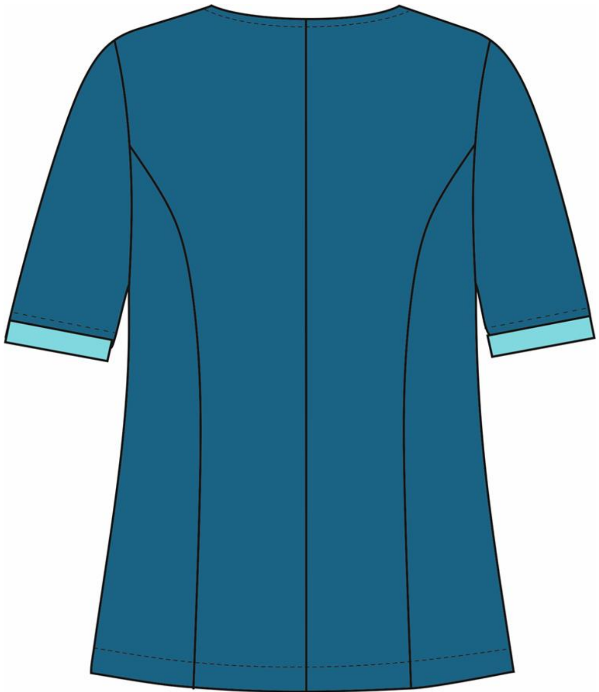
Рис.2. Эскиз Костюм женский Вояж (тк.ТиСи), блуза, вид сзади