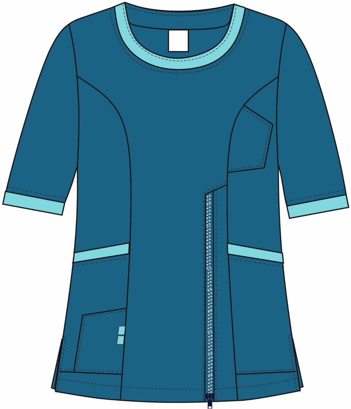
Рис.1. Эскиз Костюм женский Вояж (тк.ТиСи), блуза, вид спереди