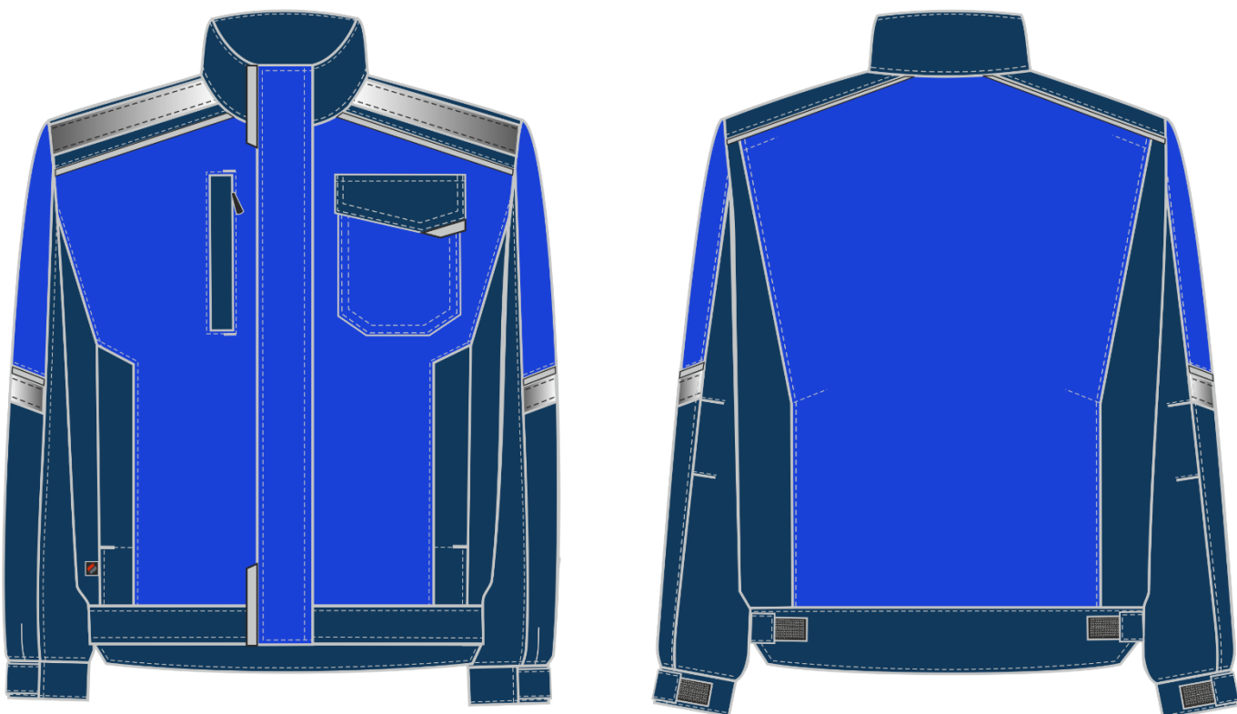
Рис.2. Эскиз Костюм Сервис NEW (тк.Смесовая,240) п/к, васильковый/т.синий. Куртка, вид спереди и сзади.