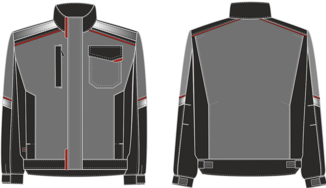
Рис.1. Эскиз Костюм Сервис NEW (тк.Смесовая,240) п/к, серый/черный. Куртка, вид спереди и сзади.