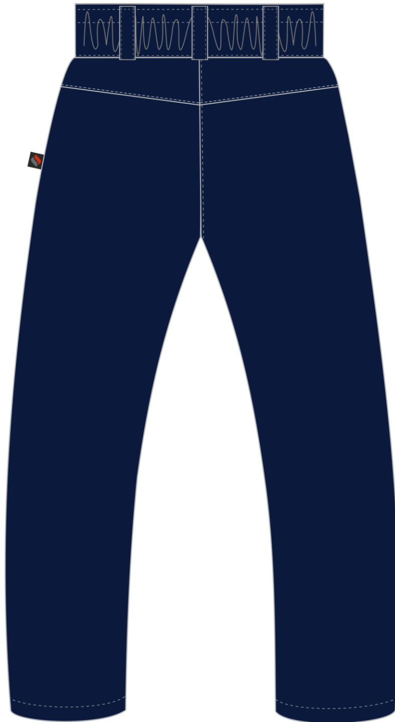
Рис. 2. Эскиз Брюки зимние женские Снежана (тк.Гаслан), т.синий, вид сзади.