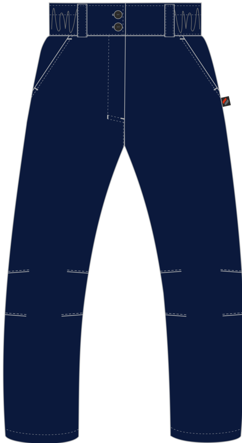
Рис. 1. Эскиз Брюки зимние женские Снежана (тк.Гаслан), т.синий, вид спереди.