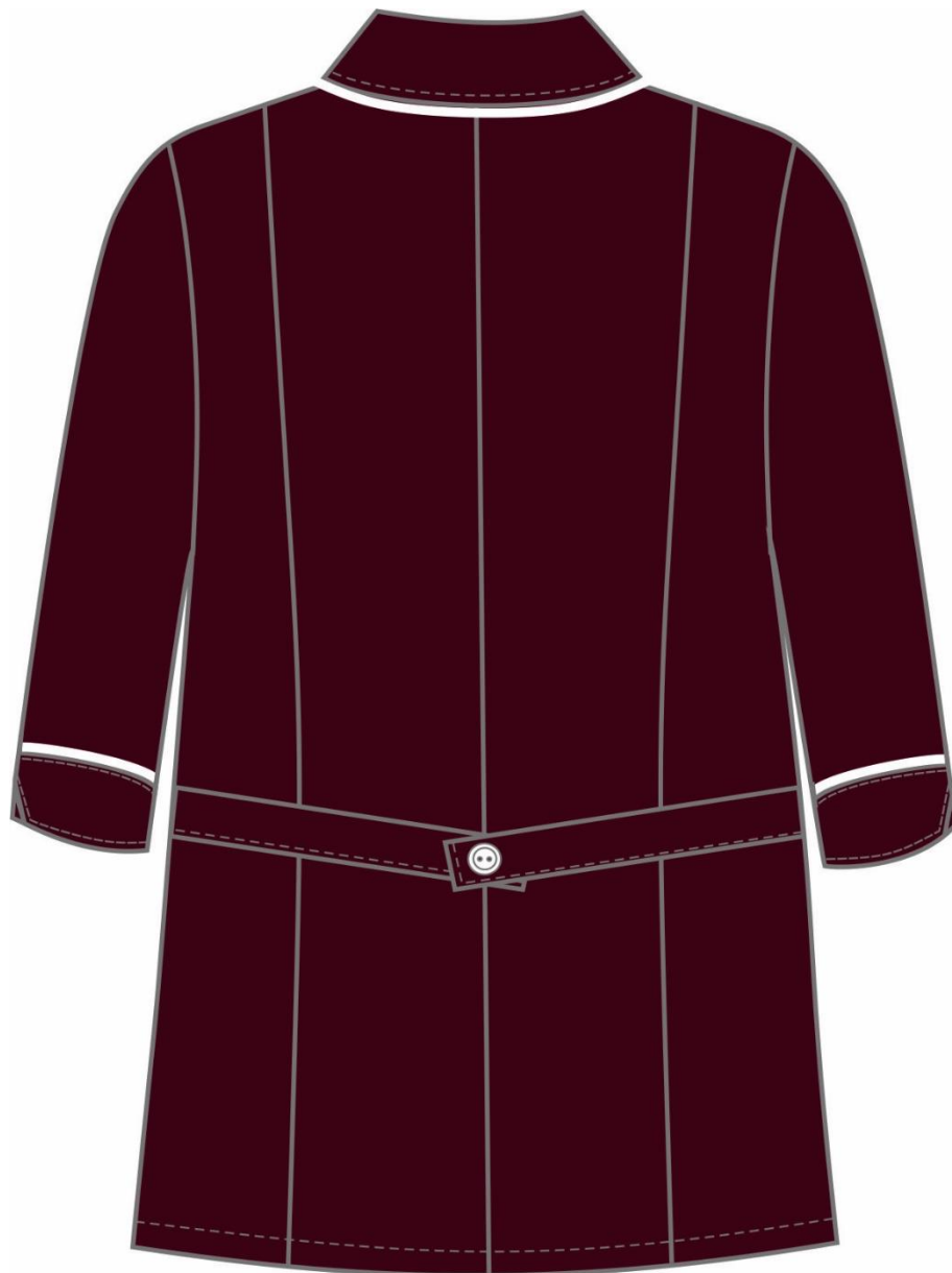
Рис.2. Эскиз Костюм женский Диана (тк.ТиСи), бордовый. Блуза, вид сзади.