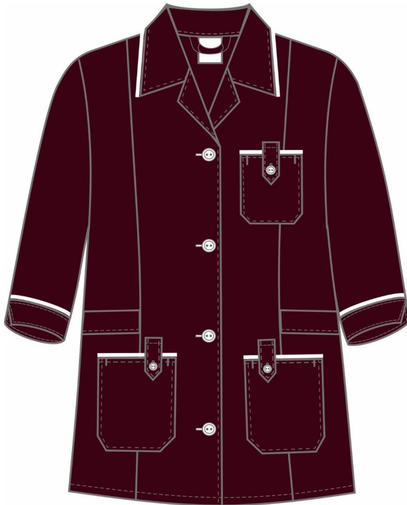
Рис.1. Эскиз Костюм женский Диана (тк.ТиСи), бордовый. Блуза, вид спереди.