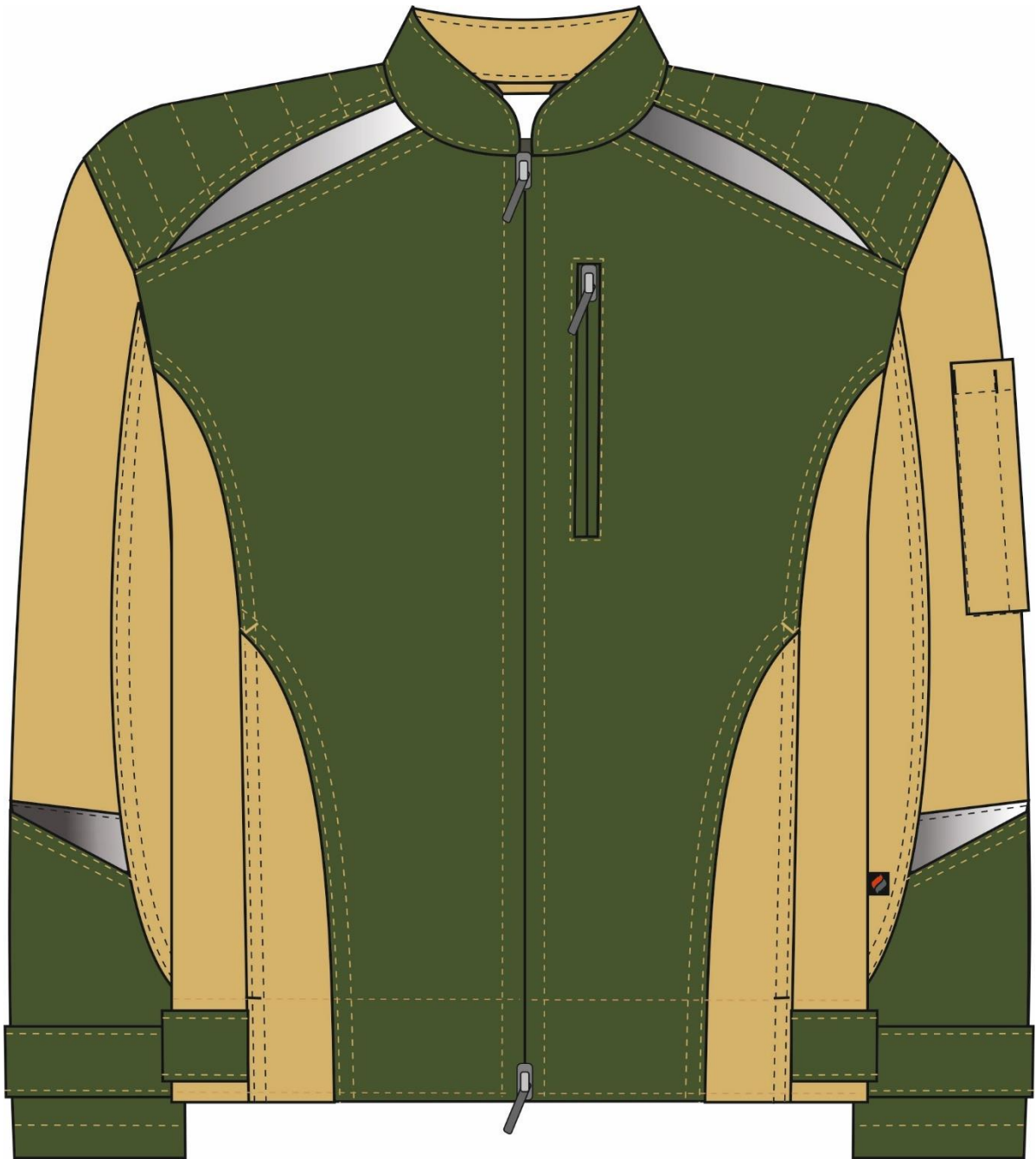
Рис.1.Эскиз Куртка Челси (тк.Канвас,270), хаки/бежевый, куртка, вид спереди